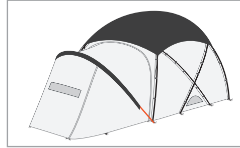
마카돔 베스티블 지주 폴대 1개를 끼워서 체결해 주세요.