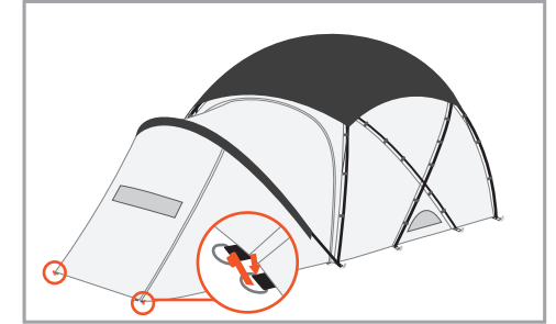
베스티블 앞쪽 두곳 최대한 당겨서 팍다운 해주세요. (팍다운 링과 출입문 링을 잘 구분해서 팍다운 해주세요.)